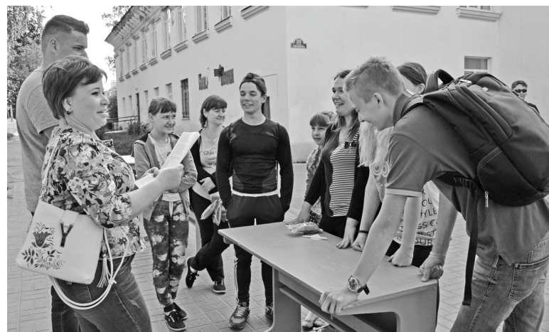
Материалы подготовила Елена Максименко, методист МККУ «ДРДК».

Работники культуры уверены в том, что эта встреча не прошла даром и пришедшие на неё ребята узнали для себя много нового и интересного. Много есть на свете хороших стран и земель, но одна у человека родная мать и одна у него Родина. И наша Родина нуждается в умных руках, добрых сердцах и бережном отношении.